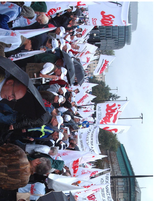
W manifestacji uczestniczyła m.in. kilkudziesięcioosobowa grupa związkowców z naszej komisji związkowej.

29.08.2008 r. w przeddzień rocznicy powstania NSZZ „S” ponad 40 tys. związkowców z całej Polski w tym kilkudziesięcioosobowa grupa z „Solidarności” Z.Ch. „POLICE” SA przemaszzerowało ulicami Warszawy w ogólnopolskiej manifestacji.