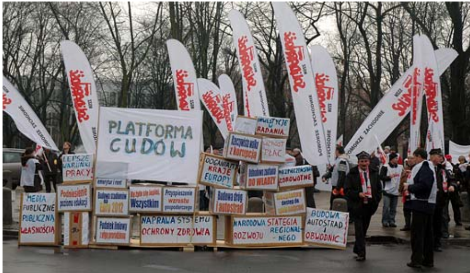
W pikiecie uczestniczyła m.in. blisko 50 osobowa grupa związkowców z naszej komisji związkowej.

- Od września domagamy się od Pana Premiera poważnych rozmów nie tylko o emeryturach pomostowych, oświacie czy służbie zdrowia, ale także o nadciągającym kryzysie. Ze zdumieniem dowiadujemy się, że rząd dopiero w tym tygodniu dostrzegł, że Polska odczuje jego skutki. Obawiam się, że